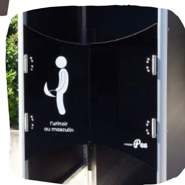
Portes battantes pour l'intimité