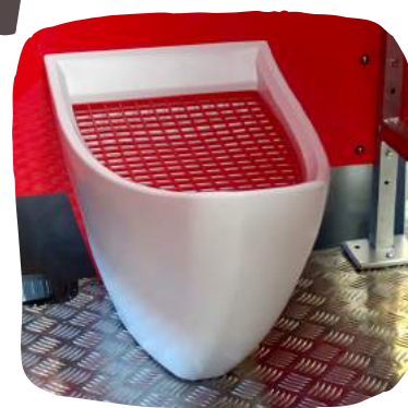
Cuvette brevetée à forme ergonomique avec grille