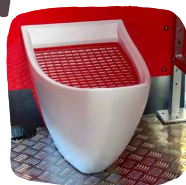
Cuvette brevetée à forme ergonomique avec grille