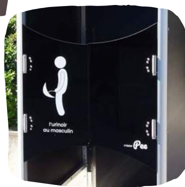
Portes battantes pour l'intimité

Encombrement minimum L 80 cm P 120 cm H 210 cm (toit plié) Poids 120 kg